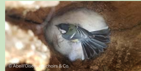
— © Abeill'Oiseaux Nichoirs & Co.